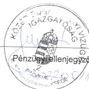
Közép-Duna-völgyi Vízügyi Igazgatóság Kezelő

KÖZÉP-DUNA-VÖLGYI VÍZÜGYI IGAZGATÓSÁG III. SZAKASZMÉRŐKÖRSÉGE 2300 Ráckeve, Kossuth L. u. 86. Telefon: (24) 519-2111